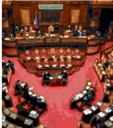
L'aula del Senato

Il Governo uscente guidato da Mario Draghi annovera, in totale, 719 persone, in Presidenza del Consiglio dei Ministri, con 6 sottosegretari; 8 dipartimenti (ministri senza Portafoglio), con 4 sottosegretari; 15 ministeri, con 6 viceministri e 25 Sottosegretari; a ognuna di queste 65 cariche politiche fanno uffici di diretta collaborazione (Gabinetto, Legislativo, Comunicazio-